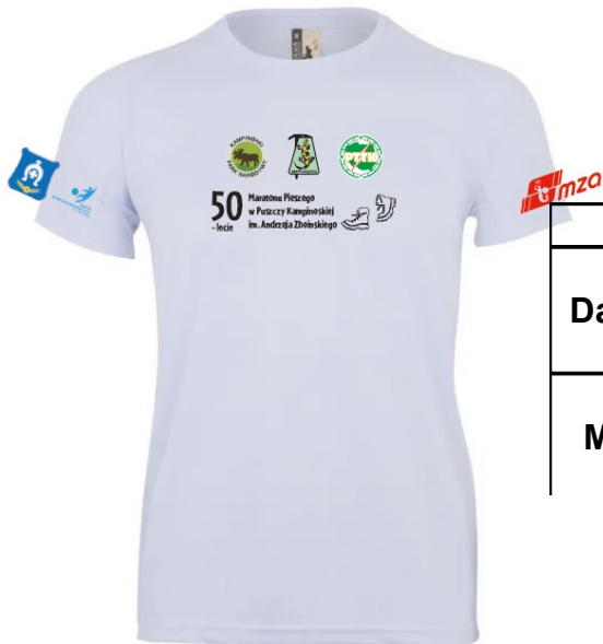
Koszulka biała poliestrowa Tabela rozmiarów: