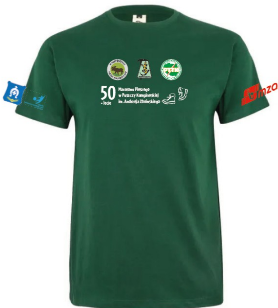
Koszulka zielona lub żółta bawełniana Dostępne rozmiary: